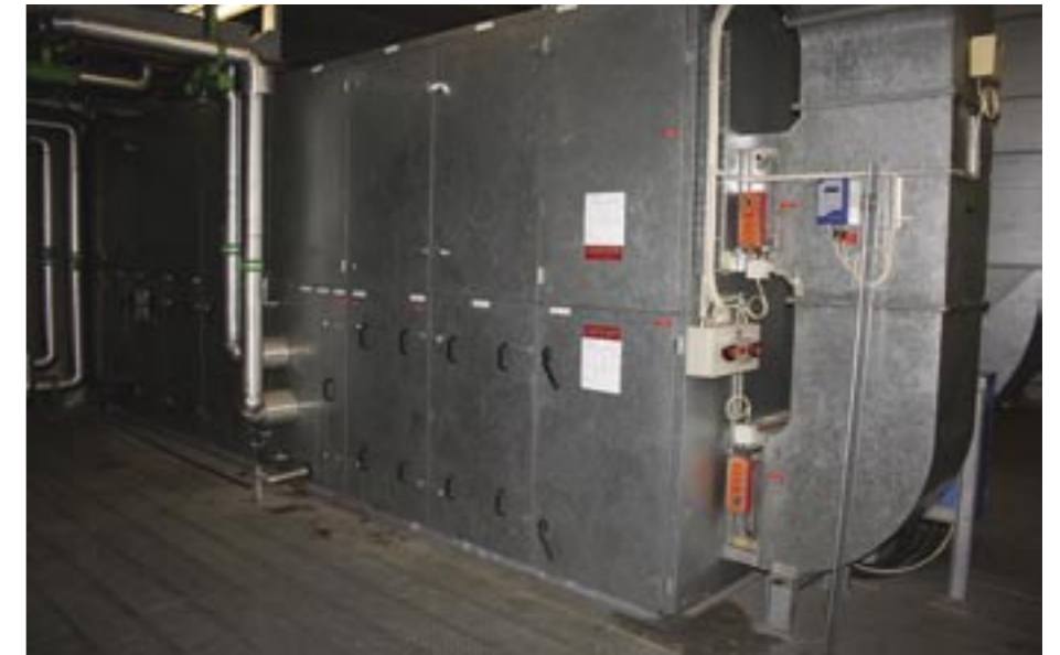
Une unité de ventilation du LHC.

"La particularité de notre solution par rapport à d'autres outils existant sur le marché est la notion d'arborescence. Il s'agit ici de faciliter l'instanciation d'objets, et donc de limiter le développement. Ainsi, pour