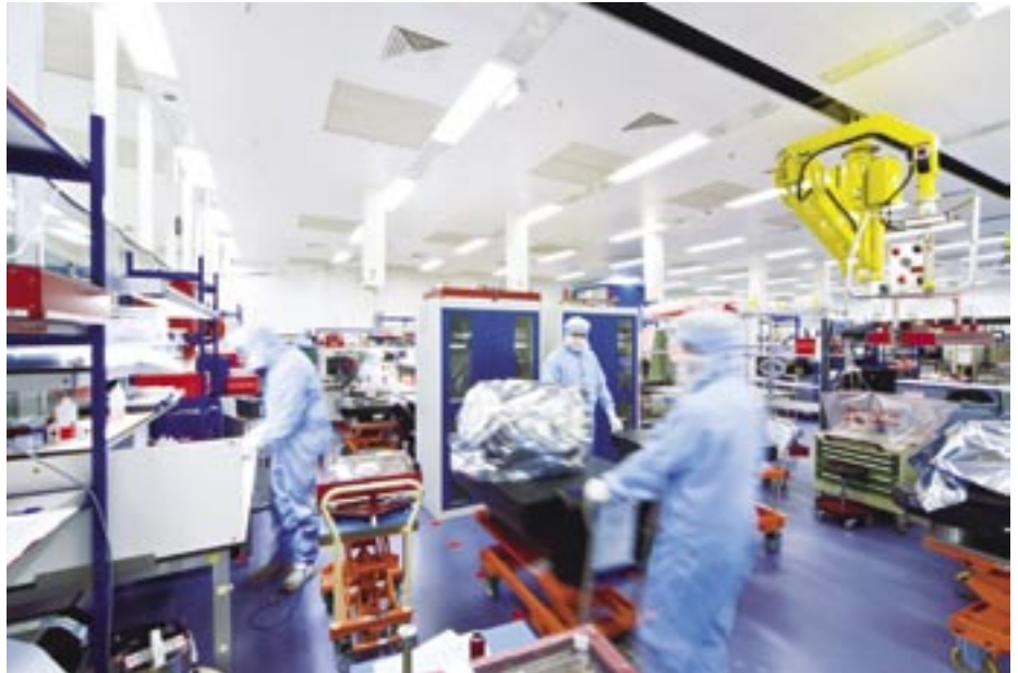
La construction de la dernière salle blanche d'ASML ne pouvait pas durer plus de 13 mois. Un délai excessivement court...