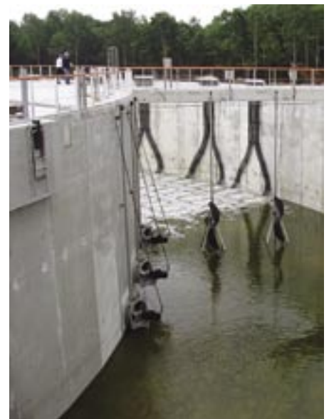
La cuve de dénitrification du bassin d'activation des boues à Eindhoven lors de la construction. À gauche, les trois pompes de recirculation, à droite (en bas de la paroi), les passages. Au milieu, quelques-uns des six propulseurs.

l'énergie" remarque Anne Bosma, conseillère en construction mécanique du département Construction hydraulique et Traitement des eaux chez Tauw. "Les bactéries convertissent les pollutions en substances inoffensives. Ces