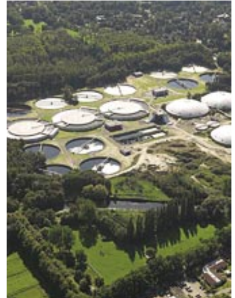
Aperçu de la station d'épuration des eaux d'égout d'Eindhoven. Les trois nouveaux bassins d'activation des boues sont visibles au deuxième rang, en haut à gauche.