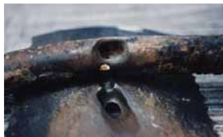
La corrosion par piqûres (en anglais pitting corrosion) est une attaque très localisée du matériau résultant de conditions de corrosion locales spécifiques.

La corrosion par piqûres (en anglais pitting corrosion) est une attaque très localisée du matériau résultant de conditions de corrosion locales spécifiques. À cet endroit se crée ainsi une anode et le reste de la surface fait office de cathode. La petite surface de l'anode et la grande surface de la cathode provoque un courant de forte intensité du côté anode et ainsi une vitesse de corrosion élevée. L'appellation corrosion par piqûres fait référence au fait que la corrosion se manifeste surtout en profondeur dans le matériau et que sa profondeur est bien plus grande que son diamètre. Cette