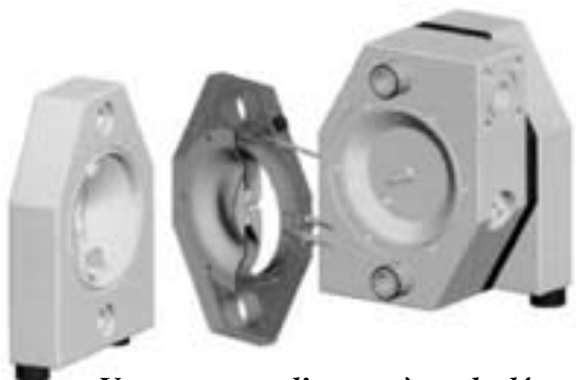
Vue en coupe d'un système de détection de fuite des membranes, une évolution des pompes AOD.

N ous avons donc interrogé la plupart des fournisseurs de ce marché et nous publions dans les lignes qui suivent une synthèse de leurs réponses. Ces pompes sont souvent utilisées sur des applications difficiles, parfois par le caractère corrosif des liquides, parfois par le caractère toxique ou inflammable. Bien sûr il y a aussi les produits chargés et/ou abrasifs et les produits alimentaires. Les gammes sont très vastes tant par les matériaux que par les variantes (finitions, clapets...) Les constructeurs rivalisent d'astuces pour supprimer les inconvénients initiaux de ces pompes (bruit, consommation d'air, givrage...) Ces pompes ont donc pour la plupart fait d'énormes progrès tant en matière de consommation qu'en matière de fiabilité depuis quelques années. Nous livrons les résultats de cette enquête exclusive dans les lignes qui suivent en les commentant au fil de l'eau. Nous terminons cette étude par quelques réflexions générales.